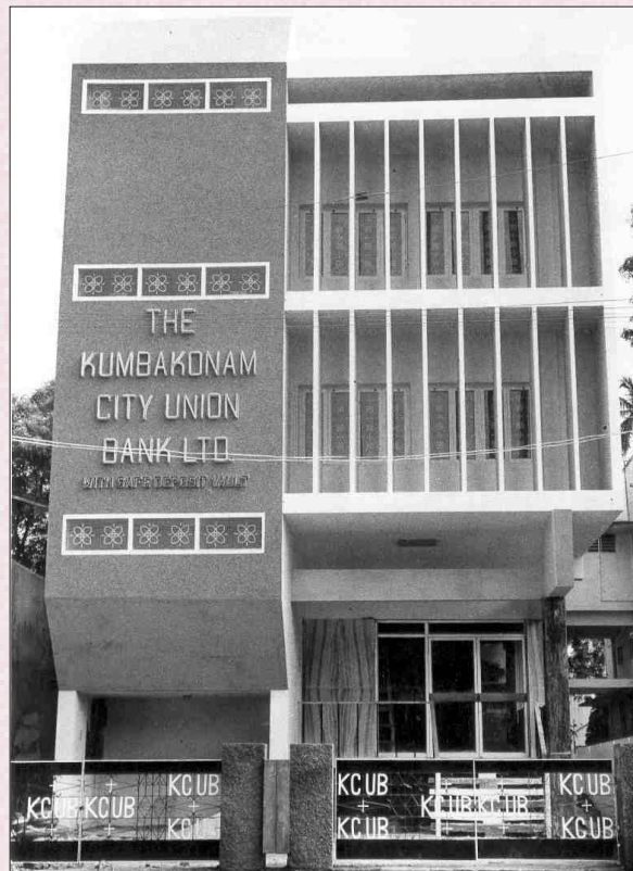
A view of our Central Office Premises - 1973