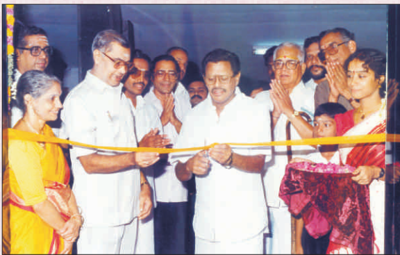
Opening of Main office Building Annexure