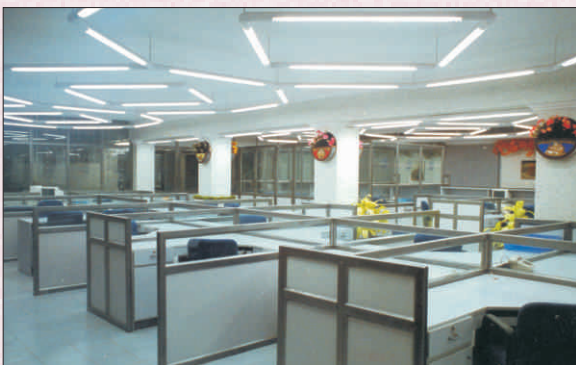
Main Office - Present Banking Ambience