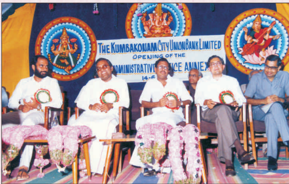
Inauguration of Administrative Office Annexure