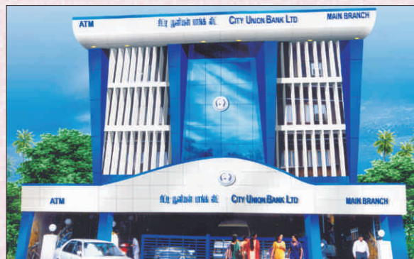
A view of Central Office - 2004