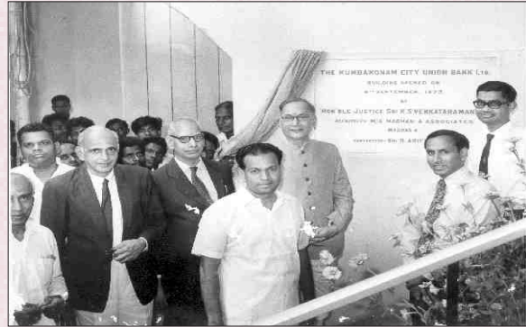
Inauguration of New Central Office Premises- 1973